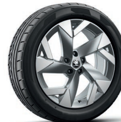
19" Tirsuli Aero а алуминиеви джанти, антрацит, полирани*