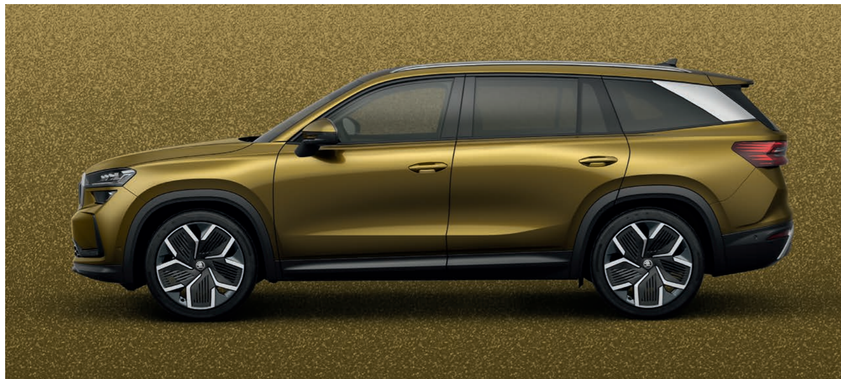
Златен бронкс металик