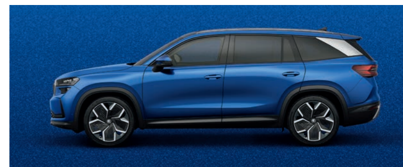
Спортно син металик