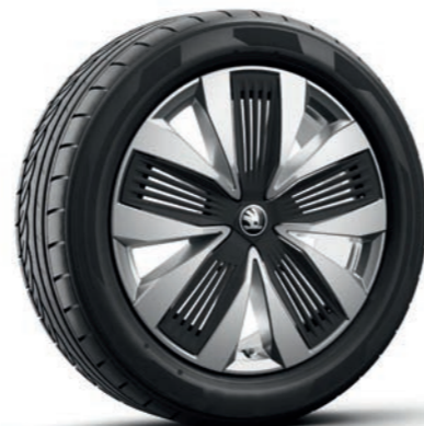
19" Talgar Aero, лети алуминиеви джанти, сребърни, полирани, с черни Aero капаци