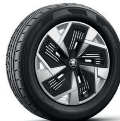
18" Mazeno Aero , лети алуминиеви джанти, сребърни, полирани, с черни Aero капаци