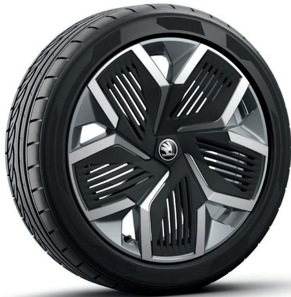
20" Rila Aero лети алуминиеви джанти, антрацит, с черни Aero капаци