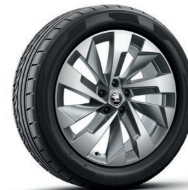
19" Halti Aero, лети алуминиеви джанти, антрацит, полирани