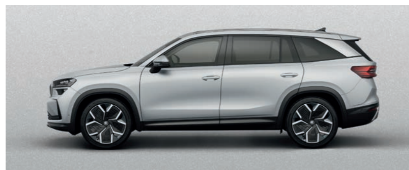
Брилянт сребрист металик