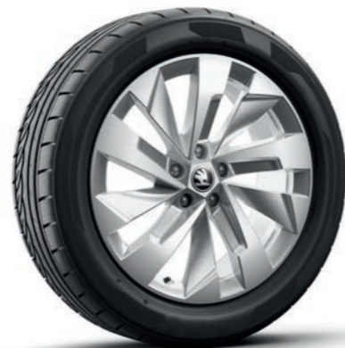
19" Rapeto, лети алуминиеви джанти, сребърни, полирани