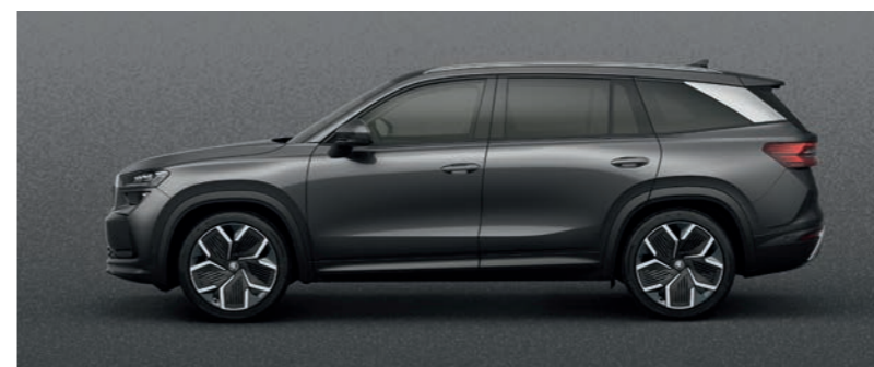
Графитен сив металик