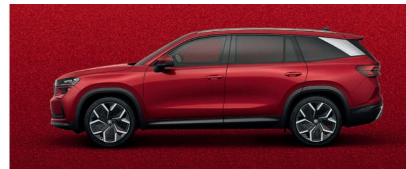
Велвет червен металик