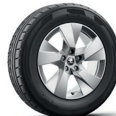
17" Paget Aero, лети алуминиеви джанти